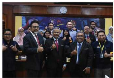
PENSIJILAN PEMATUHAN SAGA