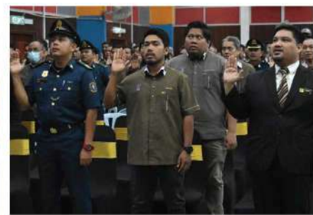
ANUGERAH PERKHIDMATAN CEMERLANG