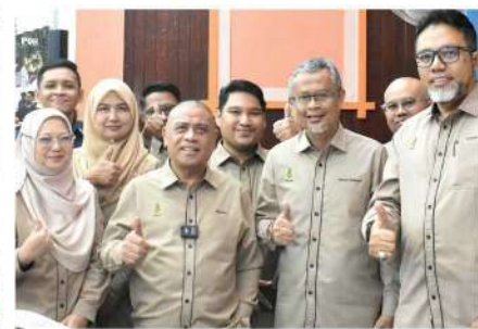
HARI BERTEMU PELANGGAN