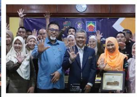
PENARAFAN BINTANG MS 10