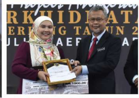
ANUGERAH PERKHIDMATAN CEMERLANG 2023 MS 4