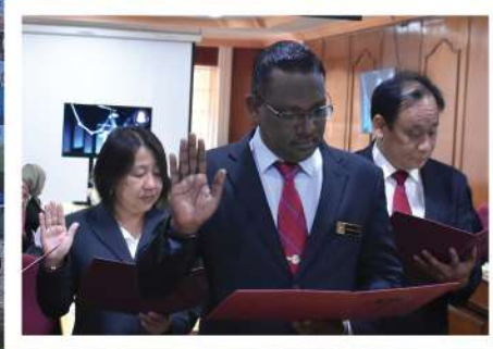
MAJLIS ANGKAT SUMPAH AHLI MAJLIS MS 8